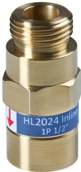
Linksboven: Control Flow Inline 1P 1/2" m-f