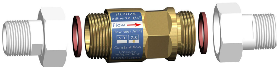
Afbeelding: voorbeeld montage Control Flow Inline 1P 3/4"

Verwijder eventuele bestaande volumestroombegrenzers bovenstrooms en benedenstrooms van het product om een optimale werking van het product te garanderen.