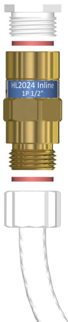
Afbeelding: Control Flow Inline 1P 1/2" f-m in leidingwerk

Verwijder eventuele bestaande volumestroombegrenzers bovenstrooms en benedenstrooms van het product om een optimale werking van het product te garanderen.